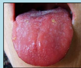
červený, tenký, krátký bez povlaku