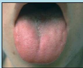
červený bez povlaku (s výjimkou kořene)