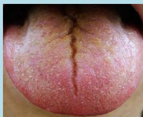
červený bez povlaku, srdeční rýha