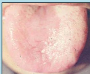
částečně bez povlaku

Rozdíly oproti klasickému předchůdci: ● silnější účinek na vyživování jin ● silnější účinek na tišení ducha ● silnější účinek na podporu spánku