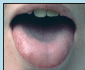
bledý a nateklý oblast plic (LU)