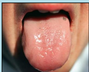
bledý a nateklý

Rozdíly proti klasickému předchůdci: ● silnější účinek na obnovu klesání čchi ● protialergický účinek (při alergickém astma)