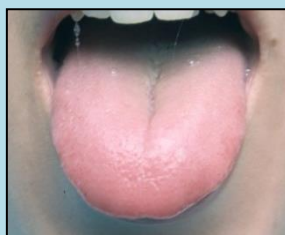
bledý a nateklý oblast plic (LU)